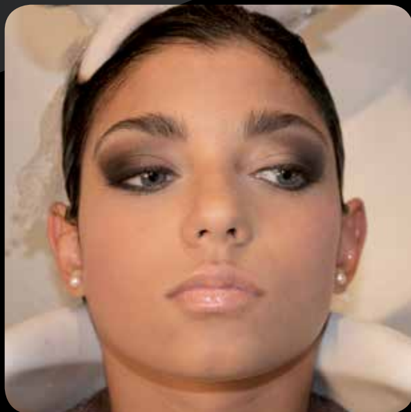
Resultado final después del enjuague