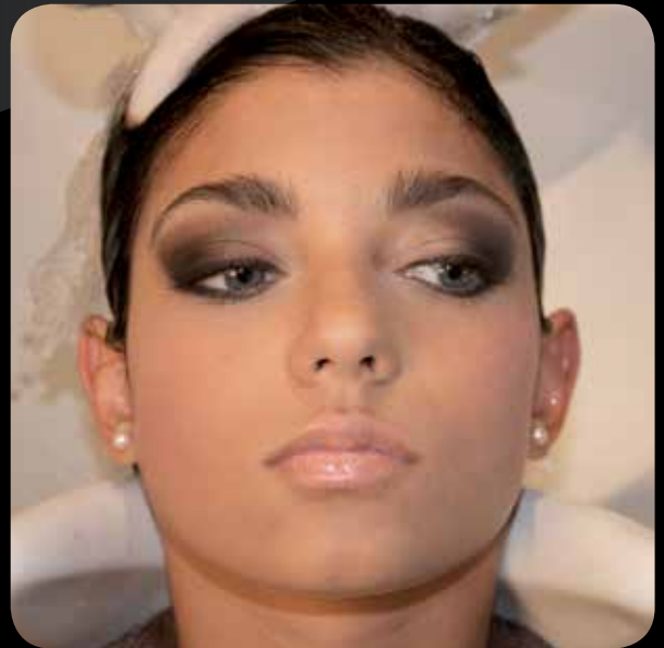
Endergebnis nach dem Spülen